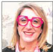
NATHALIE VIGNEAU Maire

5. Commission des bâtiments communaux, de la voirie, de l'occupation du domaine public et de la sécurité.